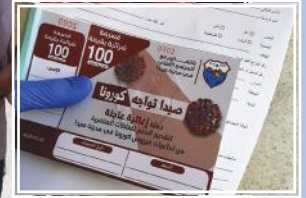
صيدا تواجه كورونا