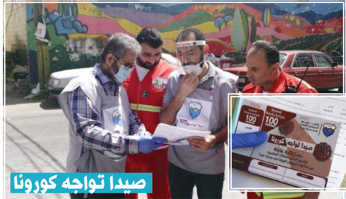
صيدا تواجه كورونا