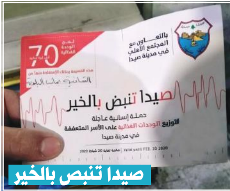
صيدا تنبض بالخير