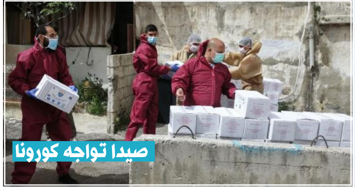
صيدا تواجه كورونا